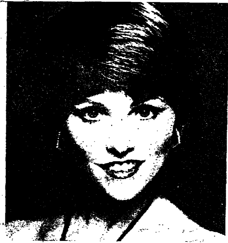
لورين تيوس - نجمة المسلسل الكويدي - قارب الحب